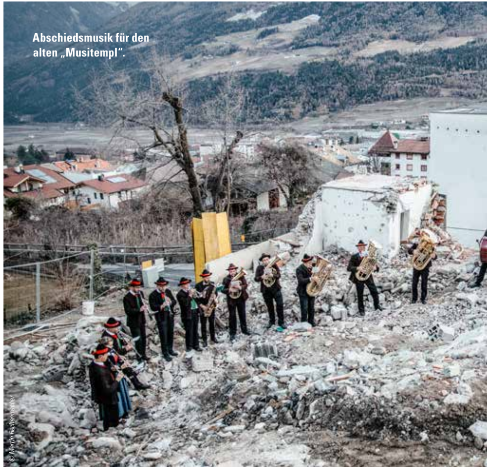
Abschiedsmusik für den alten „Musitempl“.

Gemeinsam mit dem siebenköpfigen Bauausschuss der Musikkapelle Kortsch wurde intensiv und sehr fruchtbringend zusammengearbeitet. Die Kortscher Musi hat das große Glück, viele verschiedene Handwerker und praktisch veranlagte Menschen unter ihren Mitgliedern zu haben, die sich gemeinsam mit den heimischen Unternehmen während der gesamten Bauphase mit dem Baufortschritt auseinandergesetzt und bei der Planung der Einrichtung mitgedacht haben. Zwei ungewöhnliche Auflagen hatte das Projekt „Neubau Musitempl“ zu erfüllen: die 100 Jahre alte wundervoll gefertigte Holzdecke im ehemaligen Theatersaal der Kortscher „Musikvereinsbühne“ sollte erhalten bzw. wieder eingebaut werden, und die beiden markanten Bäume vor dem Gebäude, eine Kaiserlinde und ein Kastanienbaum, sollten den Neubau unbeschadet überstehen. Übrigens: der Kastanienbaum